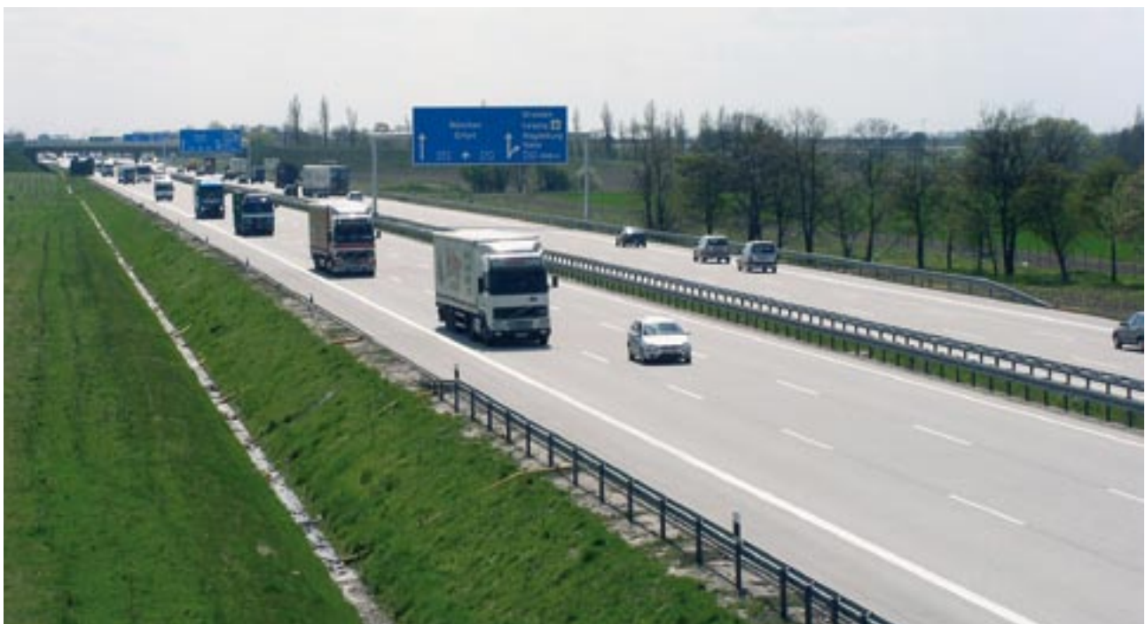
Bild 1: Betonfahrbahndecken sind auch bei hohen Belastungen dauerhaft.

Hydraulisch gebundene Tragschichten (HGT) bestehen aus ungebrochenen und/oder gebrochenen Gesteinskörnungsgemischen und hydraulischen Bindemitteln.